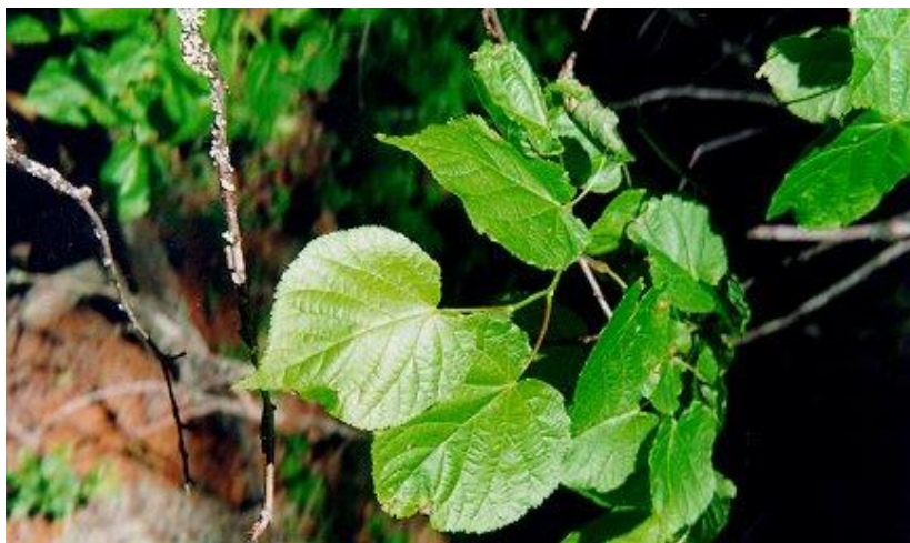
Metsälehmus (Tilia cordata)