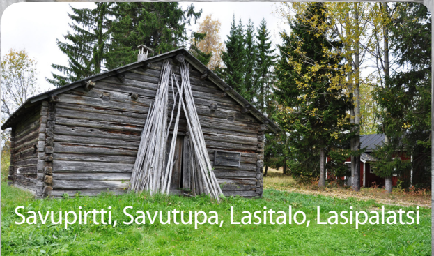
Savupirtti, Savutupa, Lasitalo, Lasipalatsi